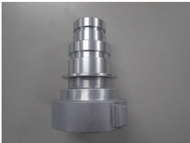
1. 40・50MC 吐水口媒介