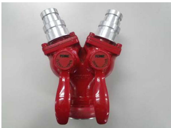
3. 40・50MC 分岐ボールバルブ