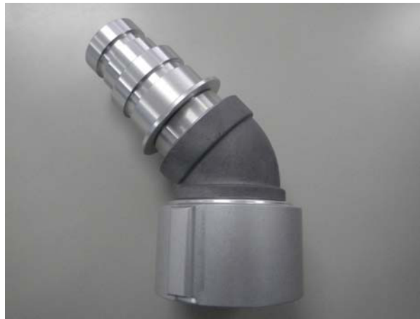
2. 40・50MC スイーベル吐水口媒介