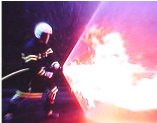
コンビ放水 棒状放水+自衛噴霧放水

自衛噴霧機構付き・可変噴霧ノズル クールファイター Model: NV-65CF